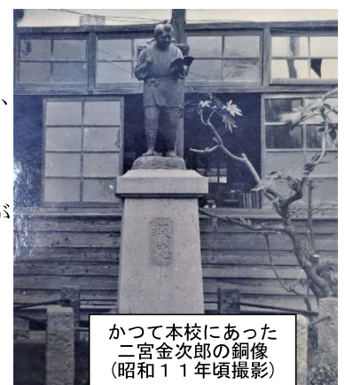
かつて本校にあった 二宮金次郎の銅像 (昭和11年頃撮影)